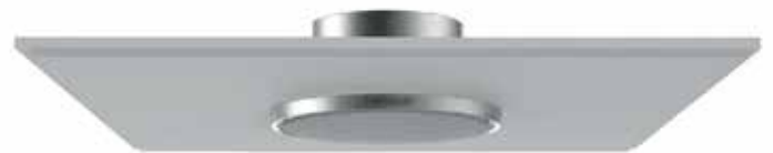
STEM SPEAKER Ceiling Mount