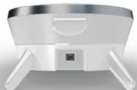
STEM SPEAKER Connectivity