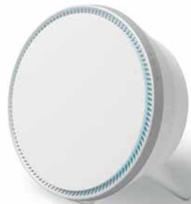
STEM SPEAKER Table Stand